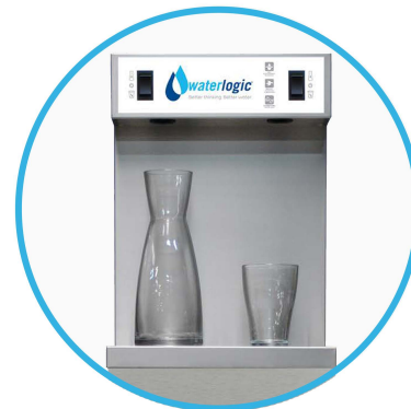
Zone de distribution grand format

Waterlogic International Limited se réserve le droit de modifier les spécifications sans préavis en fonction de l'évolution de la recherche et du développement produit. Waterlogic et le logo Waterlogic sont des marques déposées dans les pays où le groupe mène des activités. Waterlogic International Limited est autorisé à employer le nom BioCote et le logo BioCote, qui sont des marques déposées de BioCote Ltd.